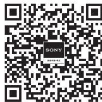
索尼专业官微 售后服务